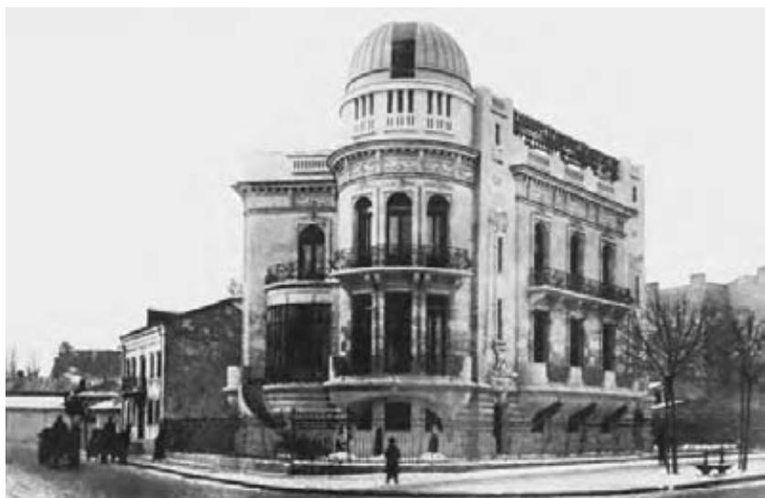
Locuința amiralului din București, devenită în 1910 observatorul astronomic al Societății Astronomice Române.