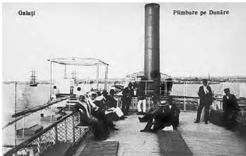
Vapoarele sunt mici și ticsite de pasageri zgomotoși.