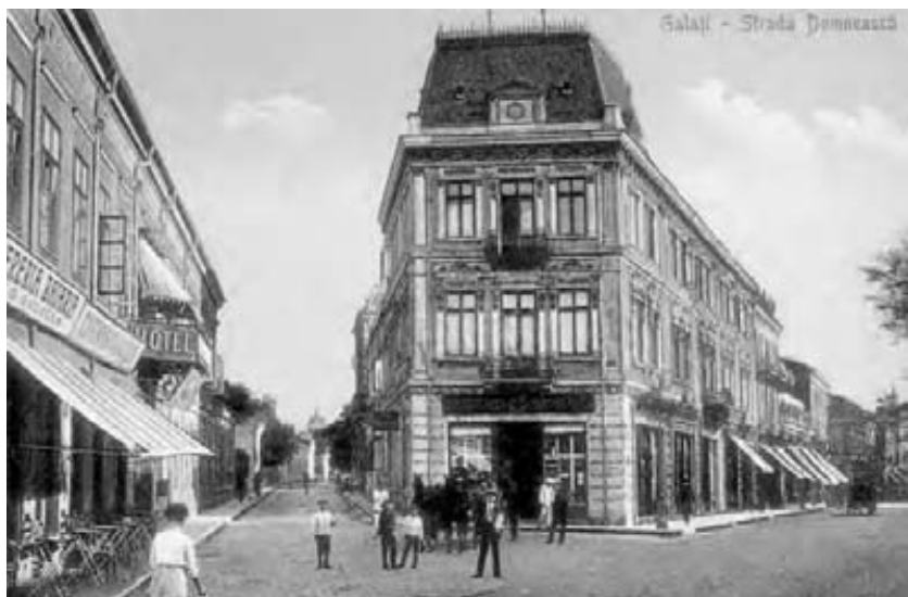
Duminicile și de sărbători, Strada Domnească e plină de oameni îmbrăcați după ultima modă...