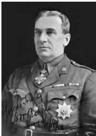
Colonelul Joseph Boyle