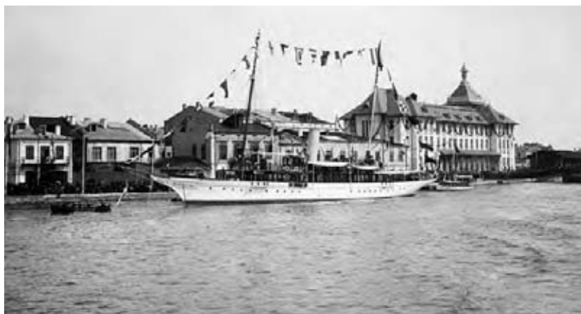
Carolus Primus , iahtul cu aburi al Comisiei Europene a Dunării, lansat la apă în 1903. Redenumit Neptun în 1948, vasul a navigat până în anul 1971.