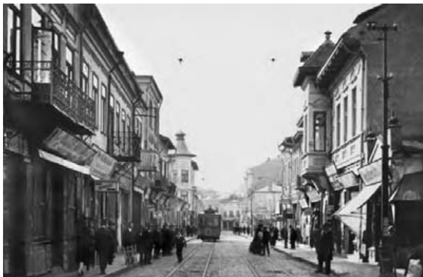
Galații au un farmec aparte...