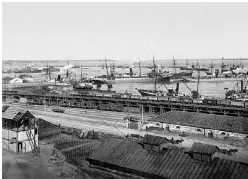
Portul Odessa la începutul secolului XX.