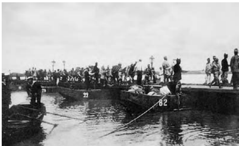
Trupele române trec Dunărea în Bulgaria, în 13 iulie 1913.