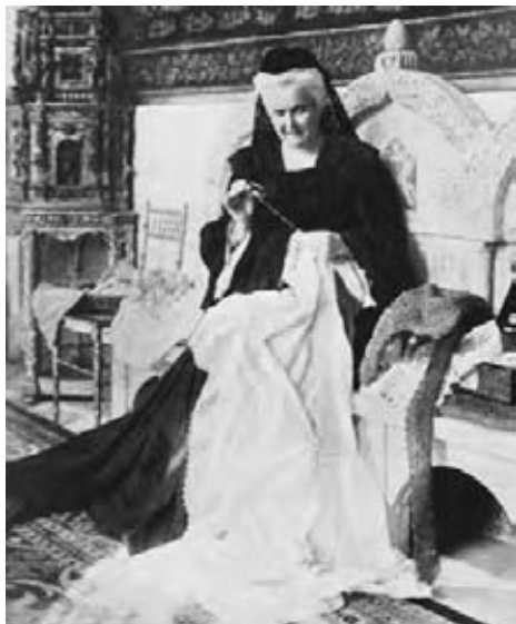
Regina Elisabeta după moartea regelui Carol (poză publicată în New York Times în 1915)