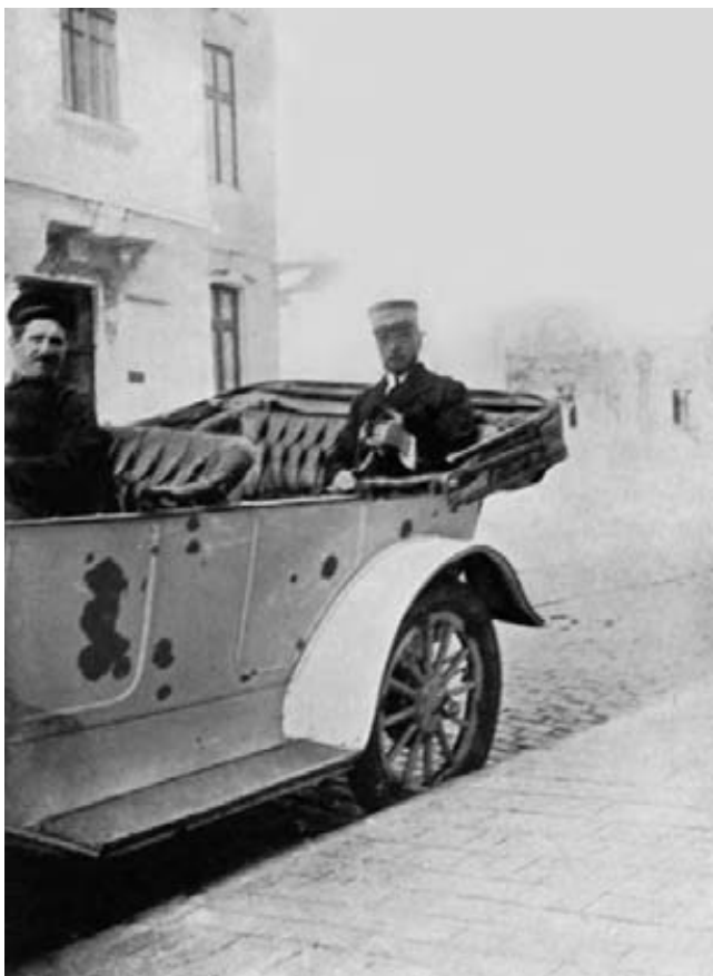
Comandorul Vasile Pantazzi la București, a doua zi după bombardamentul din 27 septembrie 1916.