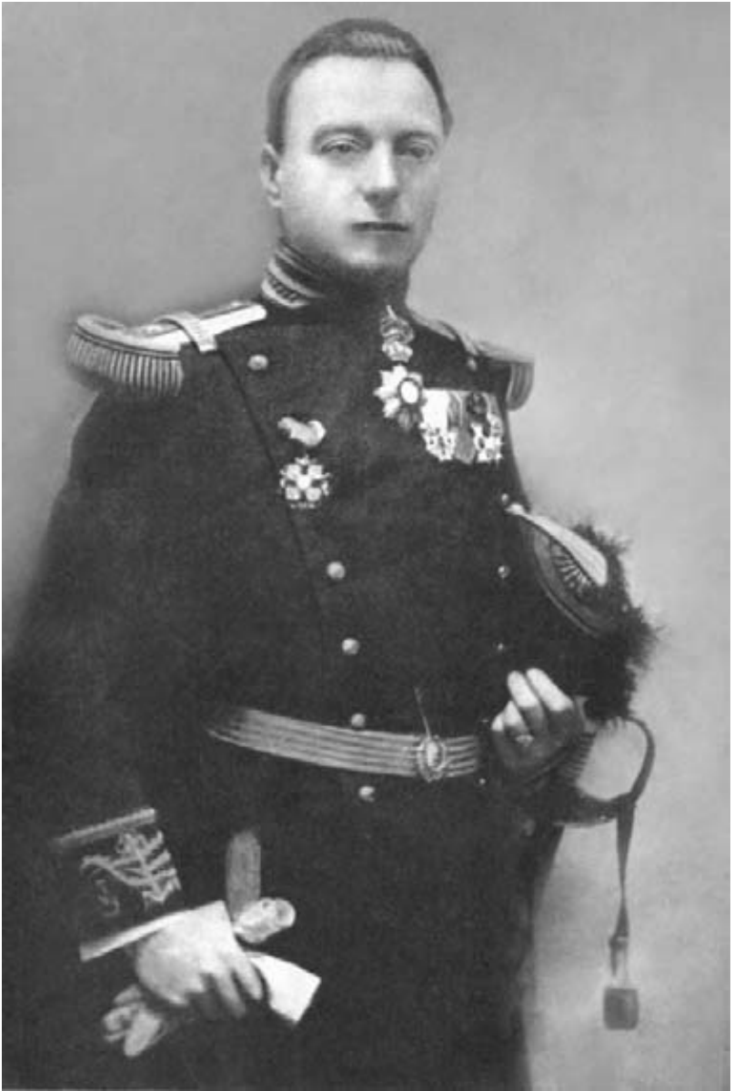
Comandorul Vasile Pantazzi