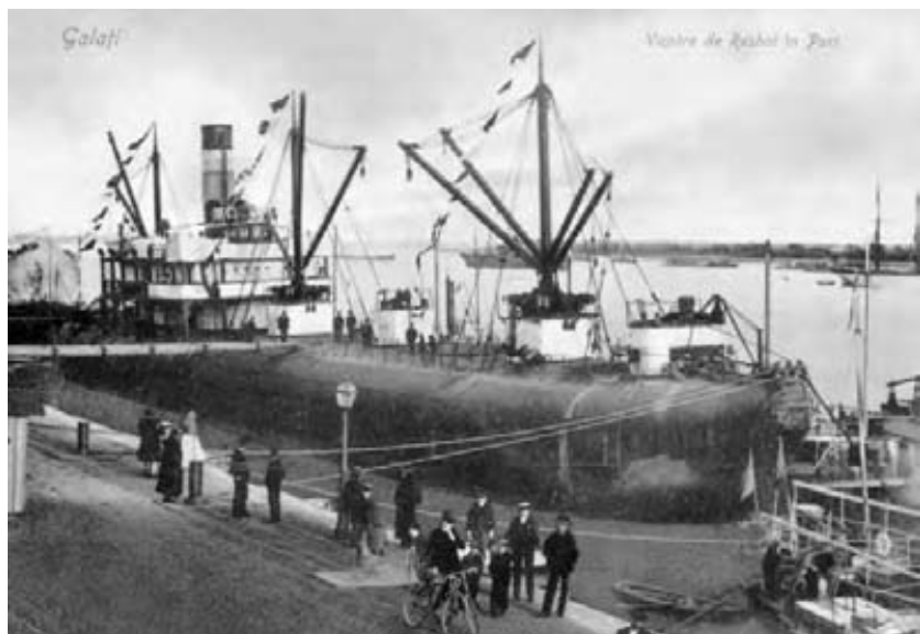
Vase de război în portul Galați