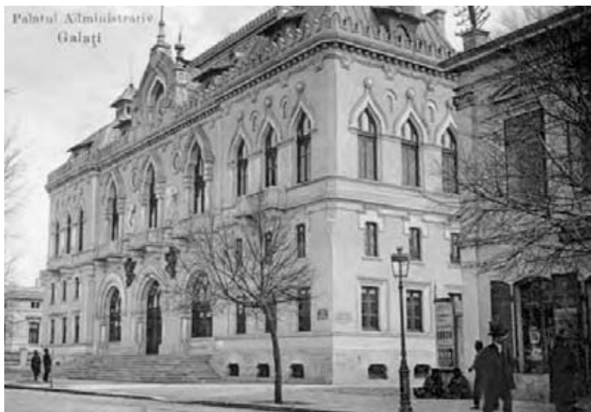
Palatul Administrativ de pe Strada Domnească din Galați, ridicat după planurile lui Ion Mincu, a fost inaugurat în 1906 în prezența principelui Ferdinand și a principesei Maria.