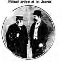
In fața conflagrației

In fața conflagrației, guvernul trebuie să ia măsuri pentru a evita războiul. Aceasta este o situație în care guvernul trebuie să ia măsuri pentru a evita războiul.