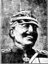
Kaiserul german, dar și împăratul țării pînă la izbucnirea...