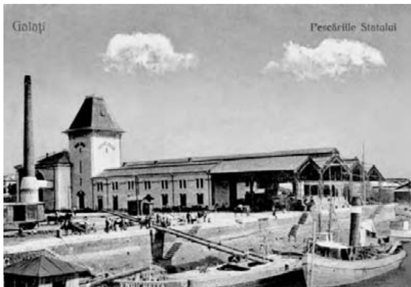
Pescăriile Statului ( sus ) și Palatul Navigației ( jos ) de pe Strada Portului din Galați.