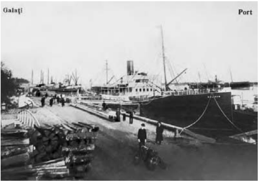
Vechiul port comercial al Galațiului ( sus ) și debarcaderul ( jos ) la începutul secolului XX.