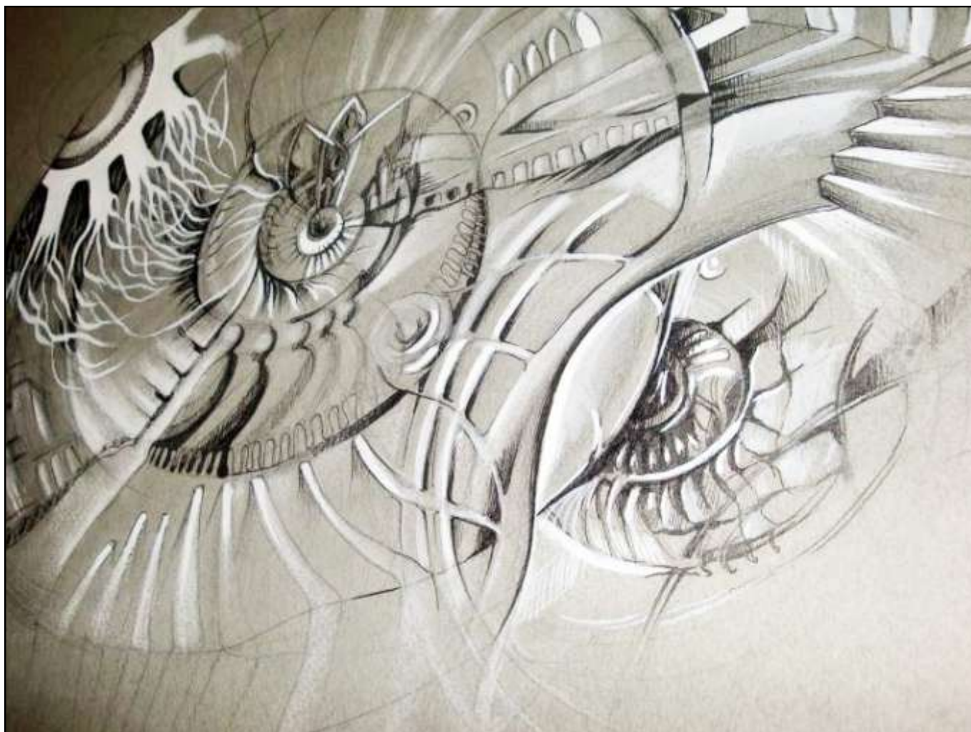
Grafică de Adriana Jurma.