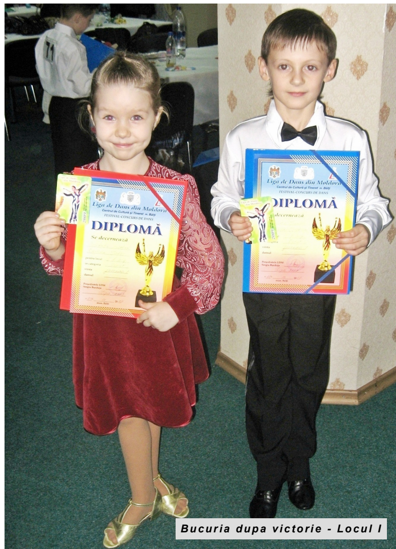
Bucuria după victorie - Locul I