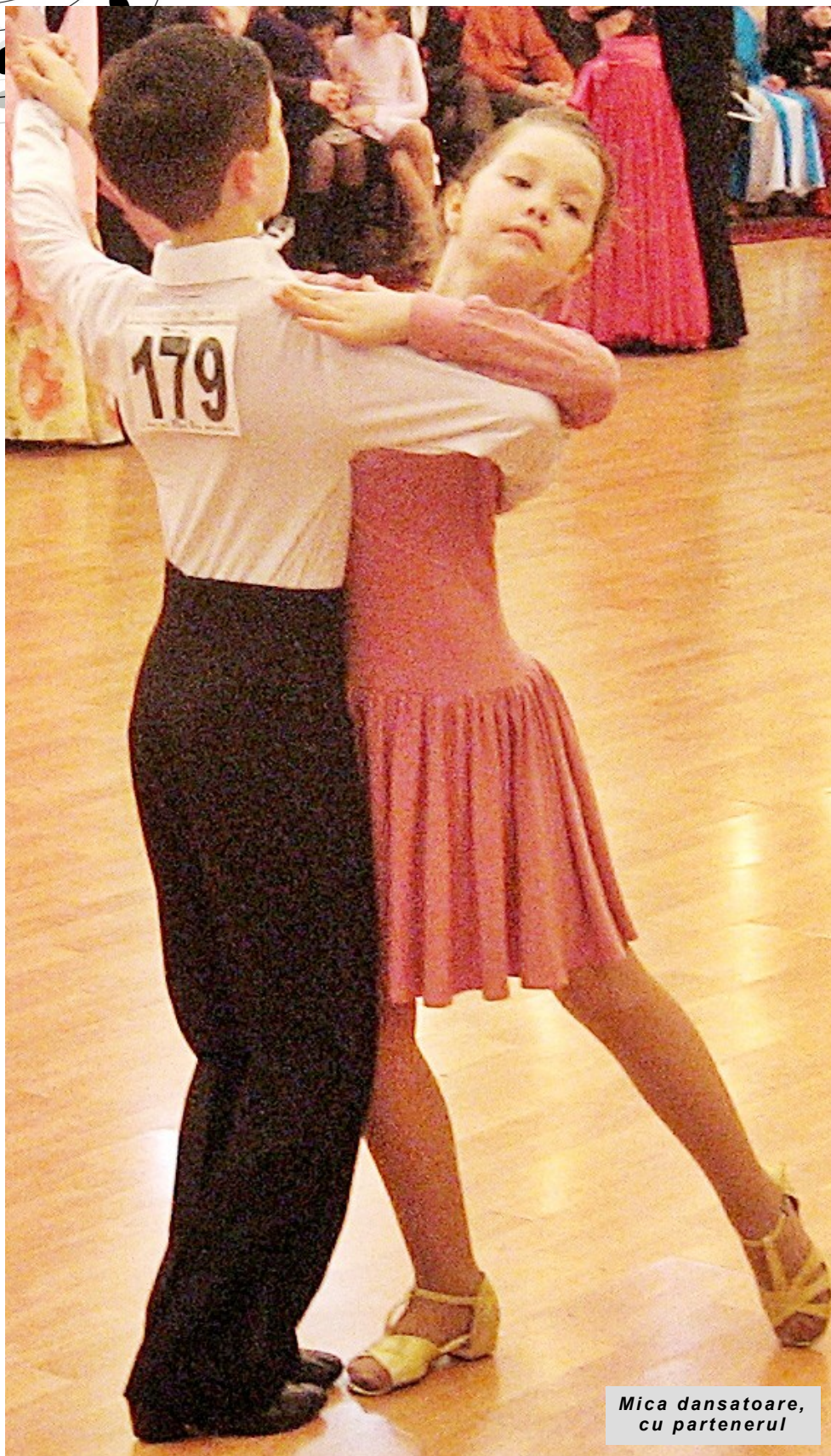
Mica dansatoare, cu partenerul

Pentru mulți din noi dansurile prezintă o activitate ușoară, aproape în formă de joc. Dar dansul este o artă, care necesită măiestrie, simțul ritmului, coordonare și plasticitate. În ultimii ani, Republica Moldova progresa cu pași mari în „universul” dansului sportiv. Cele mai vestite colective sunt „Codreanca”, „Alexa”, „ Bravissimo ”, „Aelita”, „Fantezie”, „Debut”, „Paradiz”. Dansul sportiv a